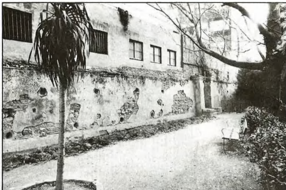
La sensació d'abandó és total

No sols això. Tots coincideixen en el fet que al Botànic s'ha de fer investigació botànica, conservació d'espècies, reproducció, un banc de llavors i, sobretot, que acompleixa la funció pedagògica i educativa, a més de servir d'esbargiment i esplai als ciutadans. I, també, que torne al Botànic el patrimoni perdut (herbaris, llibres, etcètera) i se'n conserven els fons bibliogràfics en les condicions adients.