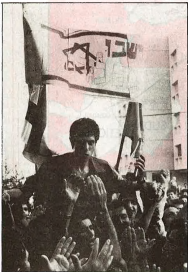
Els israelians se senten orgullosos de l'operació

elians els havien negat el dret a la ciutadania. Un debat políticoreligiós determinà, però, tot just iniciada la revolució a Etiòpia, que els falashes eren jueus de ple dret, i podien, per tant, acollir-se a la Llei del Retorn que els convertia automàticament en ciutadans israelians. A Tel-Aviv, no se li escapava el fet que, per primera vegada, s'hagués reconegut als falashes —per part del govern de Mengistu— entitat jurídica pròpia, se'ls havien repartit terres i se'ls havia respectat el dret al culte. Els sefardis van fer costat a la decisió i els askenazis la combateren. Un llarg debat s'obria al si de l'estat d'Israel.