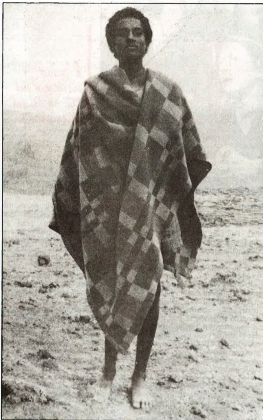
Els «falashes». Jueus i africans

Ha hagut de passar un mes llarg des de la interrupció sobtada de l'«Operació Moisés» perquè comence a insinuar-se tot el complicat entramat d'interessos que la féu possible. 10.800 «falashes», jueus i de raça negra, han estat transportats, en el temps que ha durat, d'Etiòpia a Israel.