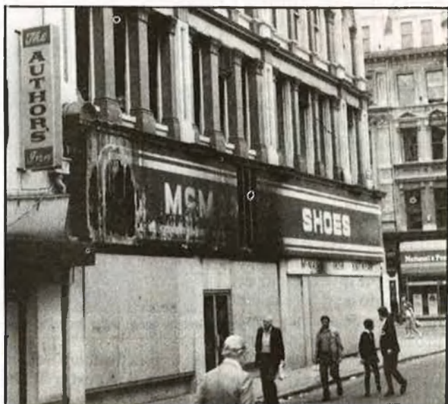
Edifici del centre comercial de Belfast, destruït en un atemptat de l'IRA

cament s'ha mantingut ferma en una de les seves postures: la condemna a l'IRA.