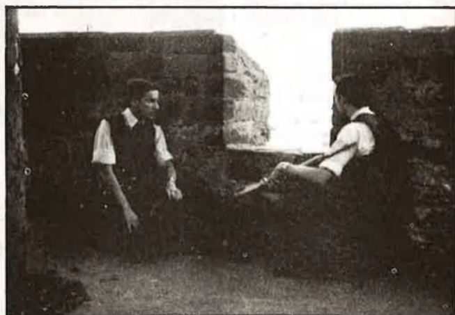
Dos membres de l'Ulster Defense Regiment (UDR), apostats a les muralles de Derry, que separen el barri protestant del catòlic