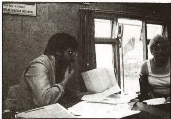
Gerry Adams, president del Sinn Fein, en el local del partit a Belfast

El 1971, la llei d'Internament, que permetia empresonar sense judici previ tot aquell sospitós d'haver participat en activitats terroristes, va empitjorar les coses. Aquell any, els morts s'elevaren de vint-i-cinc a cent setanta-tres. Harold Wilson va propor-