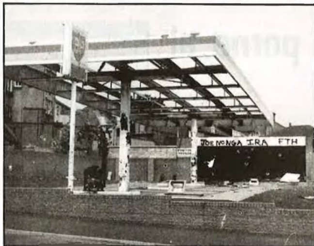
Gasolinera destruïda en un atemptat de l'IRA, a la ciutat de Derry

El govern irlandès ha realitzat nombroses campanyes d'informació a l'exterior, en les quals s'explicava que el suport a l'IRA no afavoria gens la reunificació de l'illa. La postura de la República d'Irlanda, en canvi, ha estat sempre molt amorfa. Éire depèn econòmicament del Regne Unit i, per tant, deu mantenir-hi bones relacions. D'altra banda, ha de satisfer els seus ciutadans, partidaris de la reunificació de l'illa. Úni-