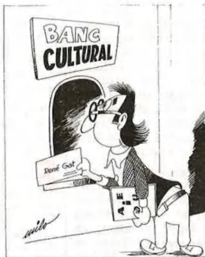
Ascolta zes aquí on paguen les lletres?