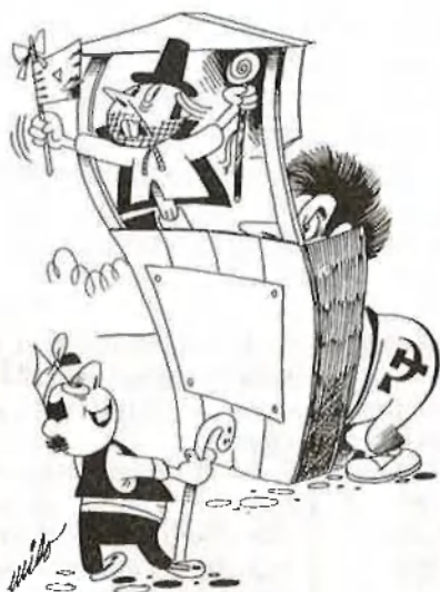
AÇÒ HA VIST MILO