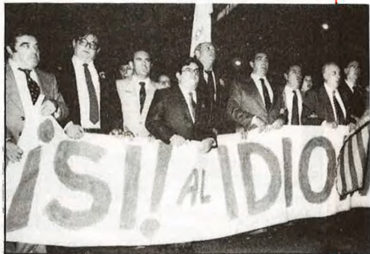
Dirigents anticatalanistes encapçalant una manifestació