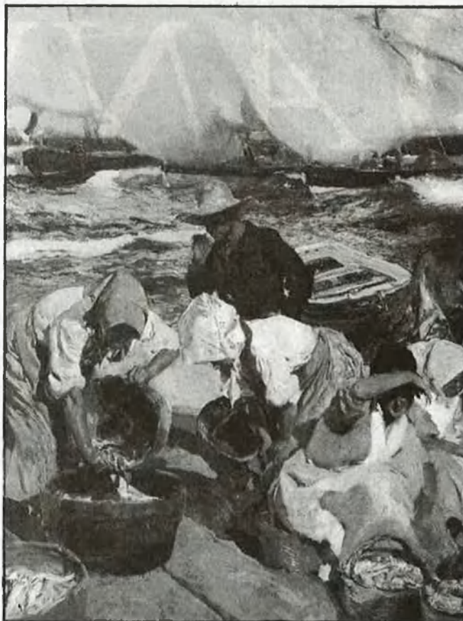
Un cromatisme atemperat i suau (Platja de València)

rolla simbolista, perquè no existeix, ni tampoc un Sorolla d'avantguarda, perquè aquest propòsit mai no entrà dins el pensament de l'artista; al contrari, cal conformar-se amb un Sorolla reduït en el seu món