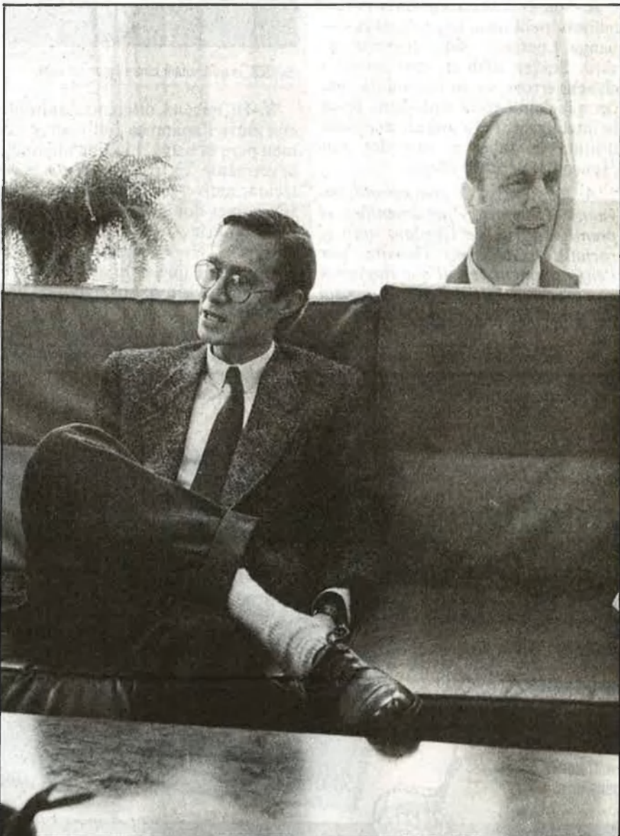
Verstrynge i la imatge reverencial de Fraga

P.-Les enquestes segueixen dient que vostés perden.