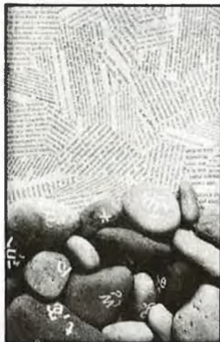
Dues obres de Bertomeu Ferrando

El millor que es pot dir d'aquesta obra és, doncs, que funciona. Que funciona l'encis sobre el qual basa les escenes, que funciona l'humor i la subtilitat i que l'estètica invitació, plena de referències, que ens proposa, ens atrapa sense reticències. Potser en aquesta facilitat o gentilesa amb què captiva hi ha el desllorigador, la clau del misteri i dels encants de l'obra.