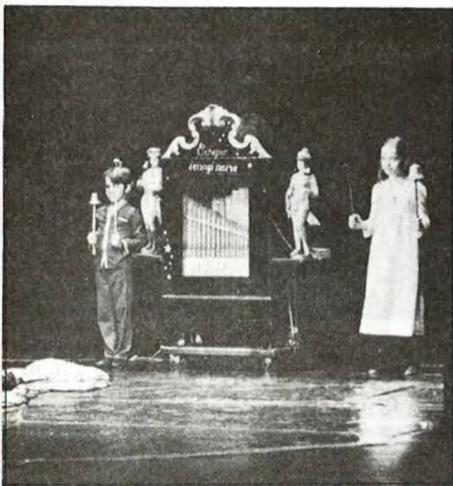
Un espectacle poc habitual

D.R. tiva convencional, el muntatge connecta, tanmateix, amb tot un corrent d'experimentació que ha funcionat en les últimes dècades. En fa, concretament, una plasmació reeixida i plena d'ofici. El circ, la