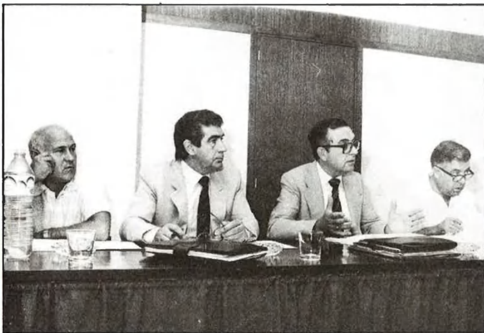
Membres de la Coalició Popular pertanyents a la Comissió de Pressupostos