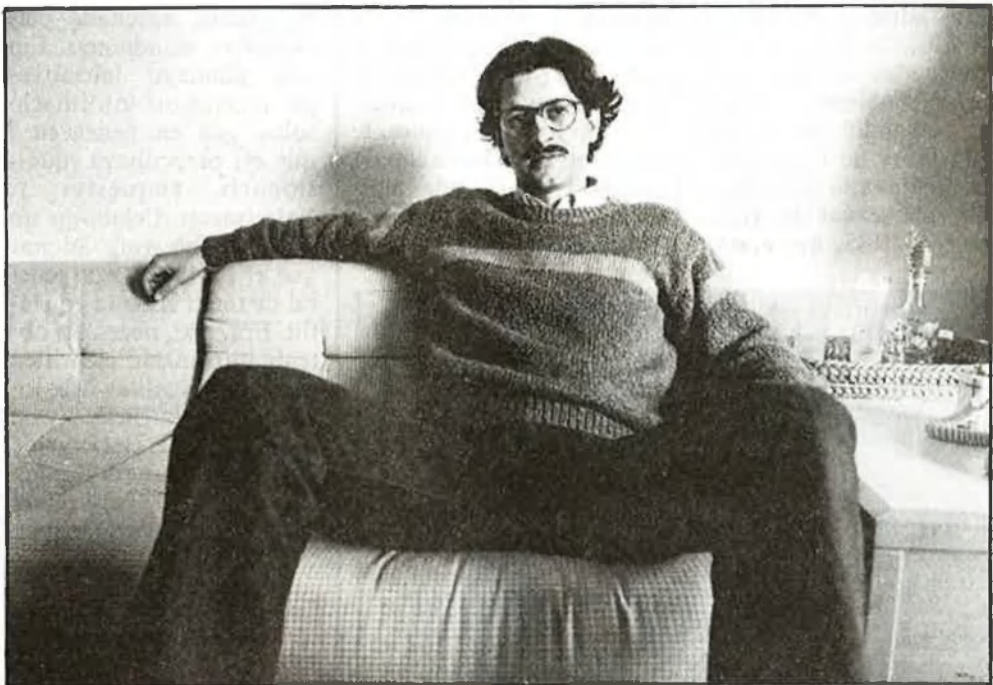
L'educació sexual ha estat incorporada en pocs llocs amb encert...

Només hi afegiré que cal una reflexió personal o en grup, abans de ficar-s'hi, i que s'ha de tenir molt en compte el tipus de persones a qui va adreçada l'experiència.