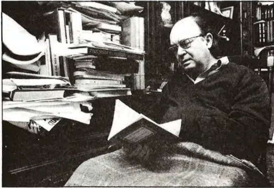
La crueltat i l'atzar l'espaordeixen