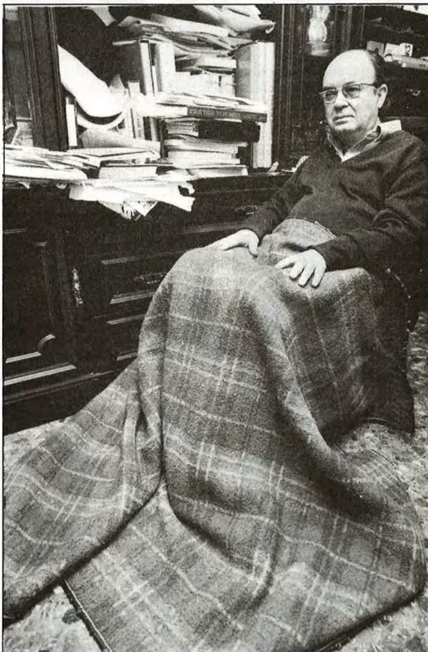
Viu en un pis ple de papers, de llibres

L'amor i la mort són dues constants en la poesia d'Estellés. Amor