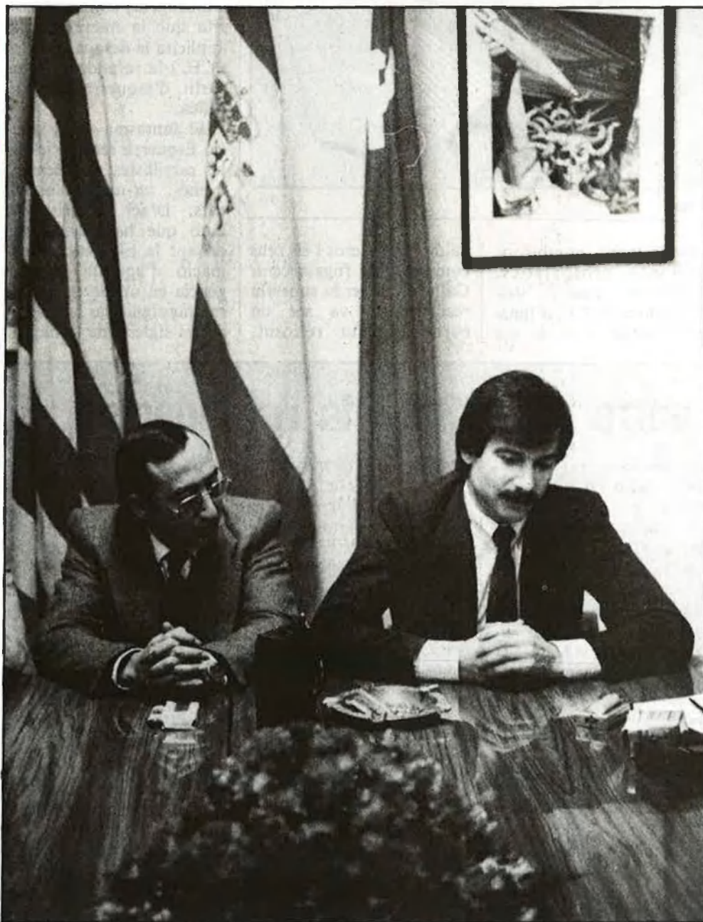
Villalba, secretari general del PCPV; Gerardo Iglesias, secretari general del PCE: dues concepcions distintes d'un mateix partit

El Partit Comunista d'Espanya és immers en una crisi que sembla no tenir fi. L'organització política més poderosa de la lluita antifranquista, després d'un esclat enorme de militància en els primers anys de la democràcia, ha patit tot d'esgarraments interns. Al País Valencià, també.