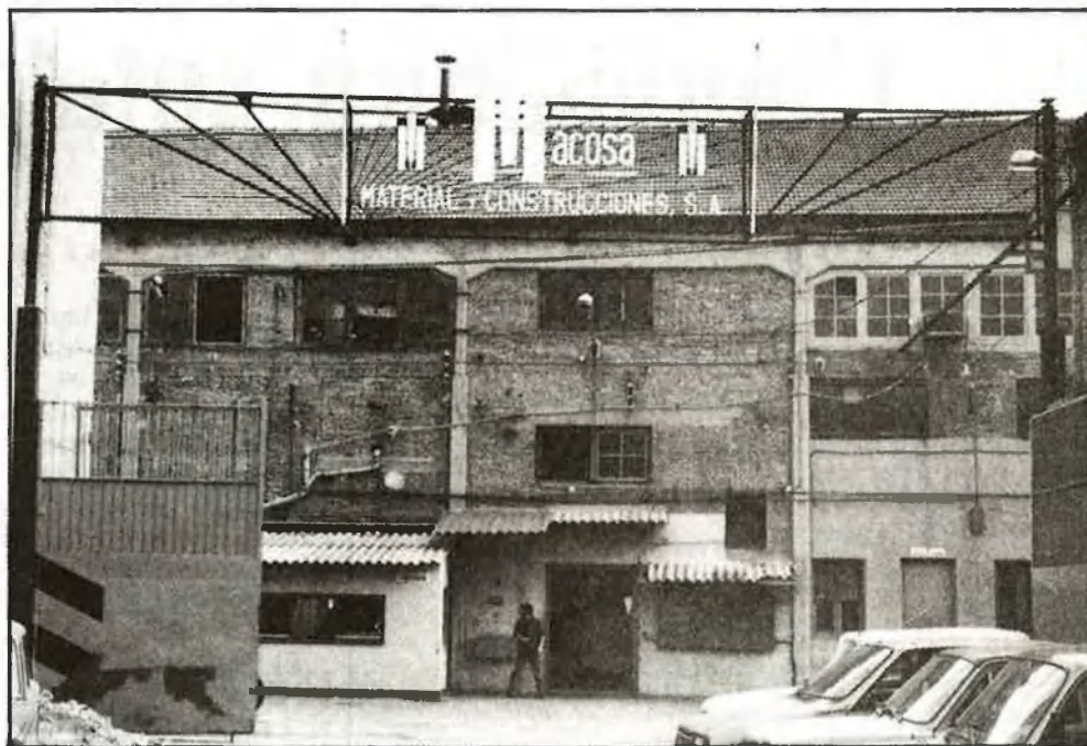
La política industrial valenciana renuncia a reconversions sectorials