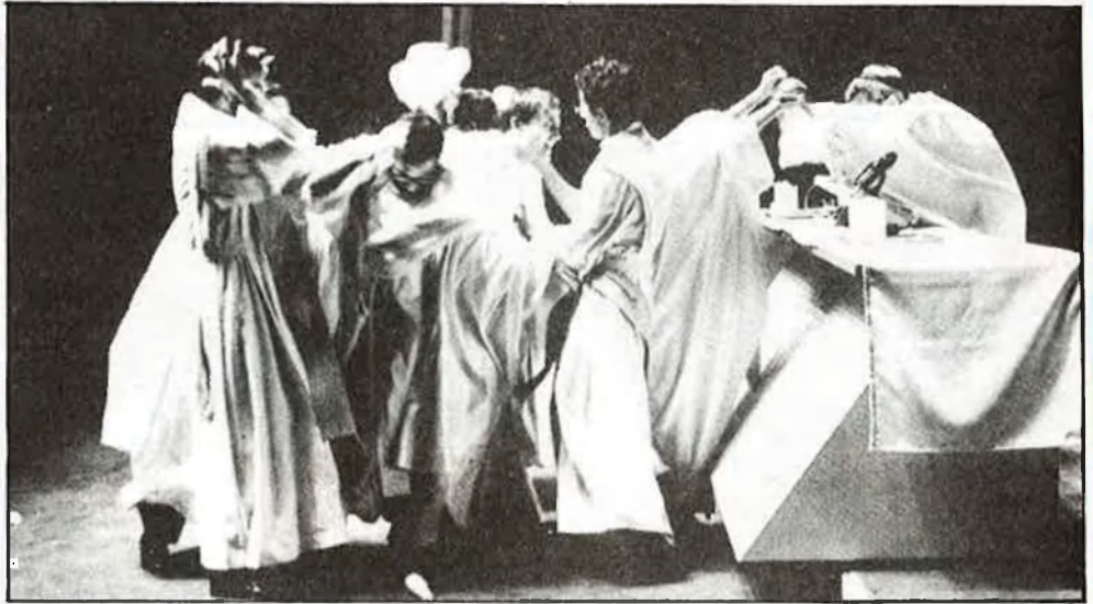
La insòlita missa en escena de «Teledeum»

Opina Xavier Fàbregas que aquests espectacles creats per Boadella utilitzen formes de comunicació pre-teatrals. Aprofitant aspectes de la tecnologia de la comunicació contemporània, efectivament. Els Joglars estableixen un joc de ficcions que esquartera