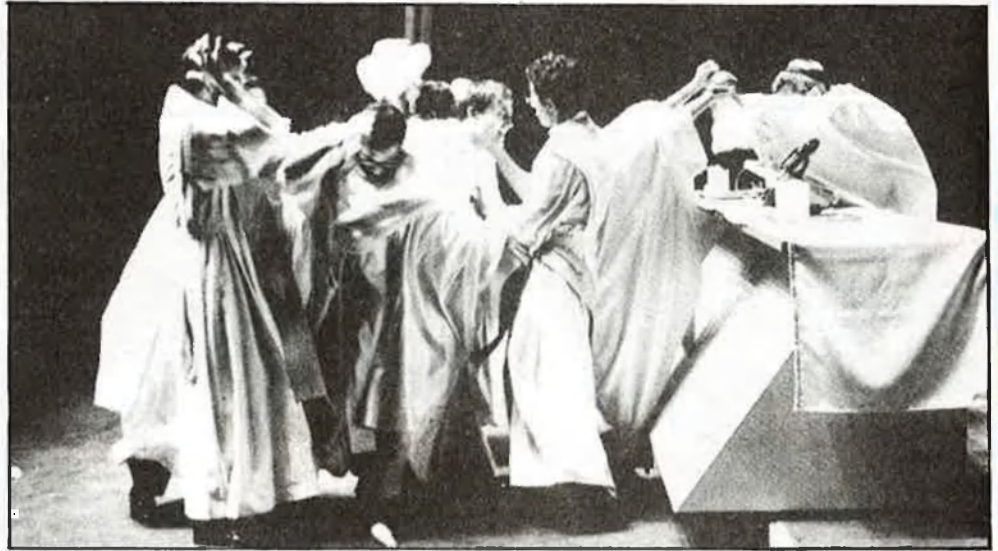
La insòlita missa en escena de «Teledeum»

Opina Xavier Fàbregas que aquests espectacles creats per Boadella utilitzen formes de comunicació pre-teatrals. Aprofitant aspectes de la tecnologia de la comunicació contemporània, efectivament, Els Joglars estableixen un joc de ficcions que esquartera