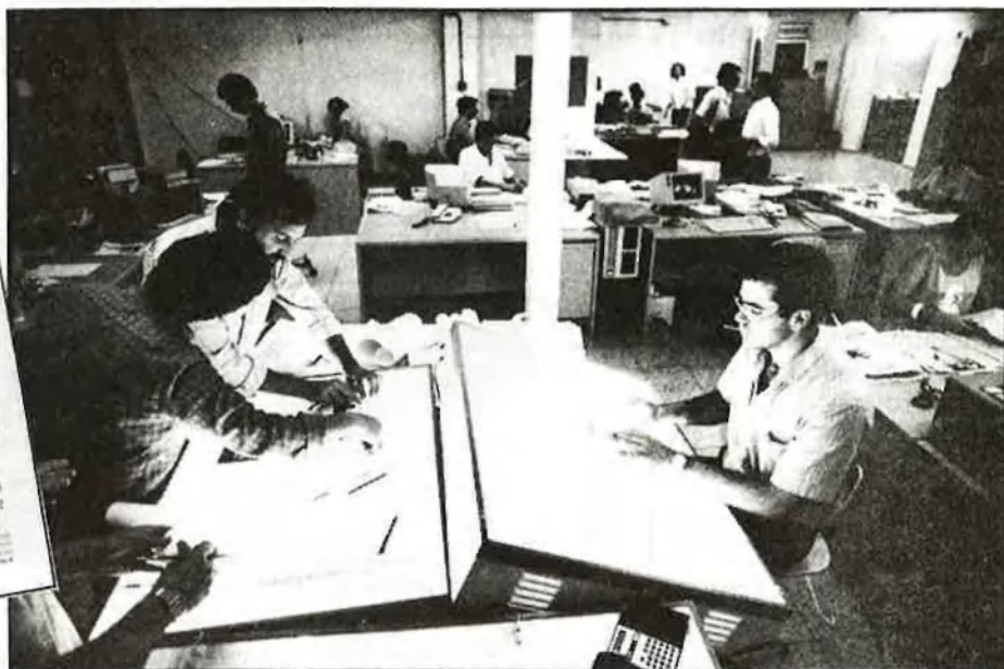
La redacció de «Liberación», dividida en cinc àrees