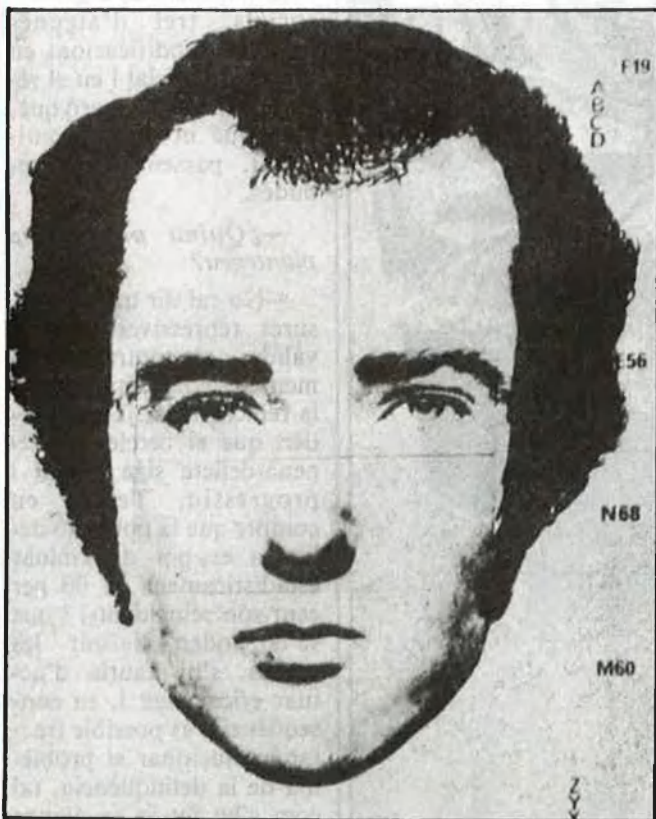
Recerca i captura

L'aspecte que ja no resulta tan seriós, per part d'aquests negociadors de la inseguretat ciutadana, és la demanda d'ajuda de les forces de seguretat si es produeix un atac terrorista. És a dir, les baixes, si és possible, que vinguen de la part governamental.