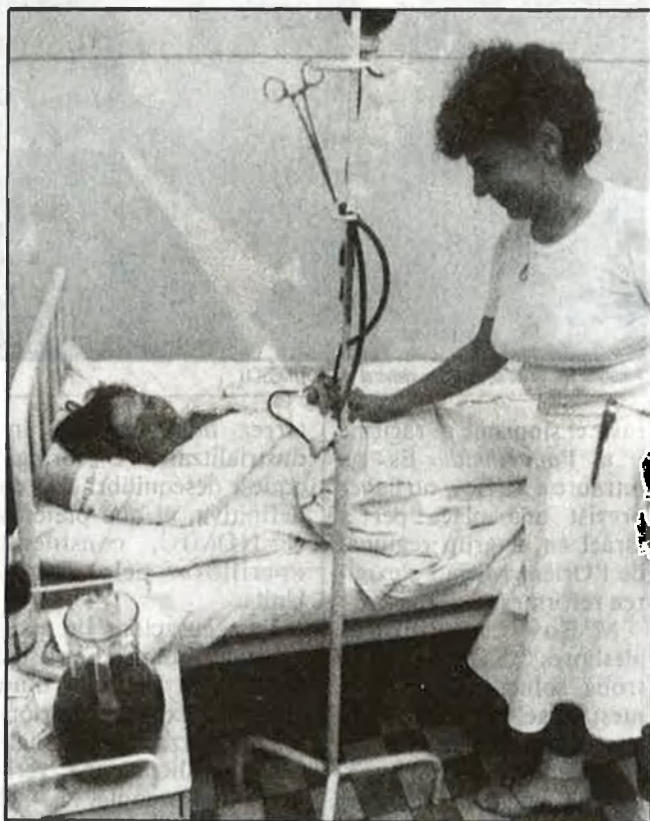
En alguns sectors es parla de la inevitable fallida de la Seguretat Social

En diversos estudis i projectes de reforma de la Seguretat Social es contemplen tres nivells de protecció: universal (per a tots els ciutadans, finançat per l'estat), professional (per a tots els treballadors, finançat mitjançant quotes d'empreses i treballadors) i un nivell complementari o voluntari , nivell a què podran accedir companyies d'assegurances, fons de pensions, etcètera.