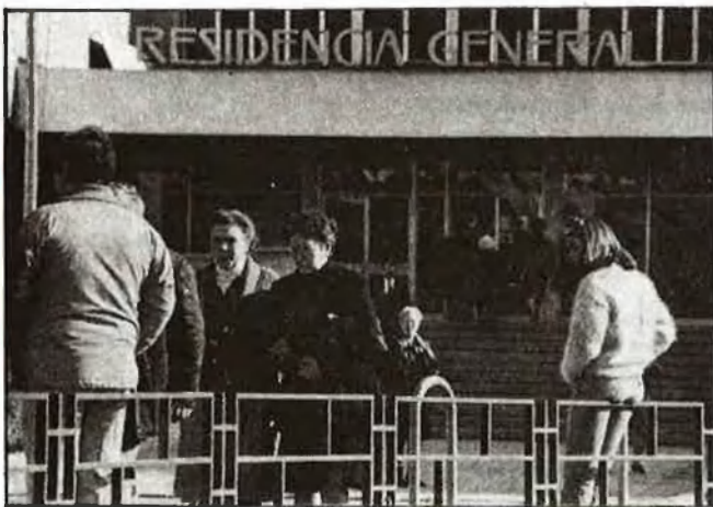
Un text legal ha de tranquil·litzar els afectats pels canvis previsibles

Pel que fa a les pensions de jubilació, el govern ha llançant sondes anunciant que es valorarà més la pensió inicial amb les cotitzacions i es prendrà com a referència un període de temps més ampli que l'actual per a calcular-ne l'import, amb un límit màxim que no es podrà superar, a canvi d'una garantia de revaloració perquè el pensionista tinga assegurat el poder adquisitiu. Els qui desitgen assegurar-se unes rendes superiors per a la