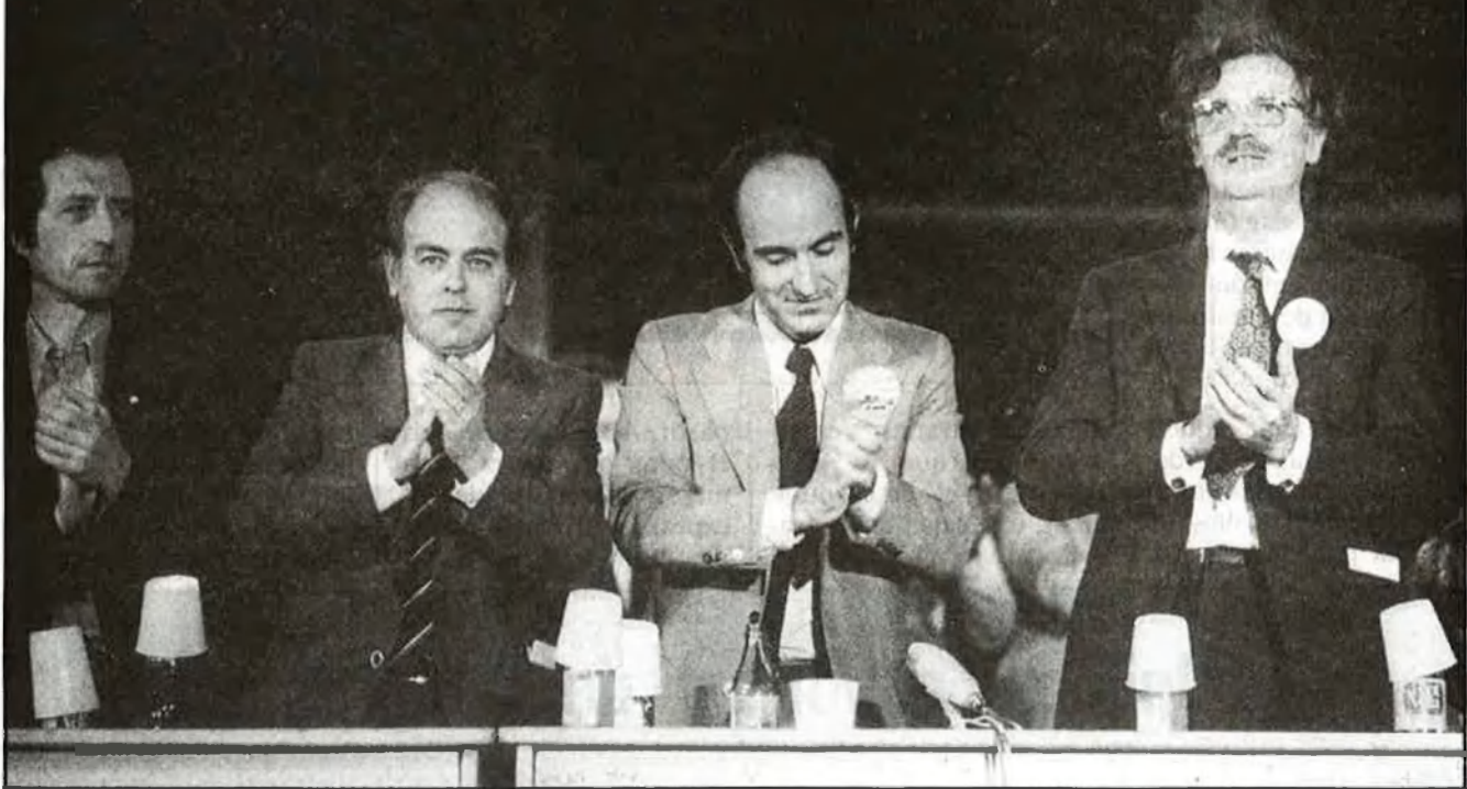
Presidència d'un míting del Pacte Democràtic, durant les primeres eleccions legislatives. D'esquerra a dreta del lector, Josep Verde (PSC-RI), Jordi Pujol (CDC), Miquel Roca (CDC) i Ramon Trias (EDC)

El pròxim cap de setmana, 11, 12 i 13 de gener, se celebrarà al Palau de Congressos de Barcelona el VII Congrés de Convergència Democràtica de Catalunya. Sota el lema «Per una Catalunya per a tothom: abans, ara i sempre», 1.248 delegats d'arreu Catalunya, elegits d'acord amb criteris locals —20 militants, un delegat, n'és la proporció—, debatran les cinc ponències que centren els treballs del Congrés. Aquesta reunió té lloc en el desè aniversari de la fundació de Convergència, quan el partit nacionalista català està governant a Catalunya, després d'haver obtingut majoria absoluta en les darreres eleccions autonòmiques realitzades ara fa poc més de mig any. El seu secretari general, Jordi Pujol, és president de la Generalitat i líder carismàtic del partit. Miquel Roca, secretari general per delegació, és el cap de la Minoria Catalana al parlament de Madrid, i líder per aclamació del nouat Partido Reformista Democràtico; en aquest congrés, rebrà el suport de tot CDC. Per aconseguir un interlocutor vàlid, Convergència necessita Espanya.