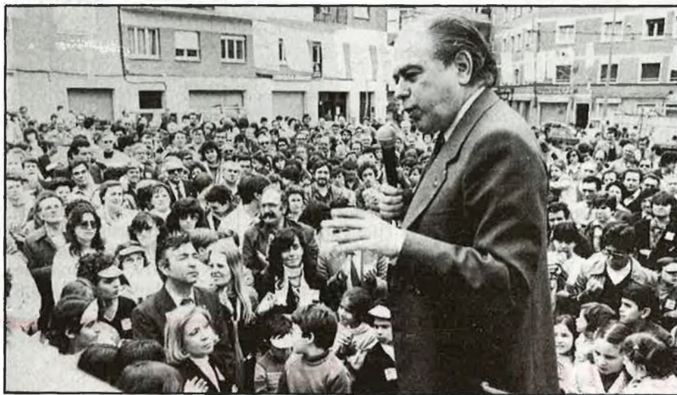
Pujol és un home d'indubtable carisma popular a Catalunya

A les primeres eleccions democràtiques, pel juny d'aquell any, CDC es presentà en coalició amb Esquerra Democràtica de Catalunya (un petit grup liderat per Ramon Trias Fargas), el Front Nacional de Catalunya i el Partit Socialista de Catalunya —Reagrupament, procedent del grup de Josep Pallach—. El Pacte Democràtic per Catalunya, nom de la coalició, va traure 11 parlamentaris, contra 15 de Socialistes de