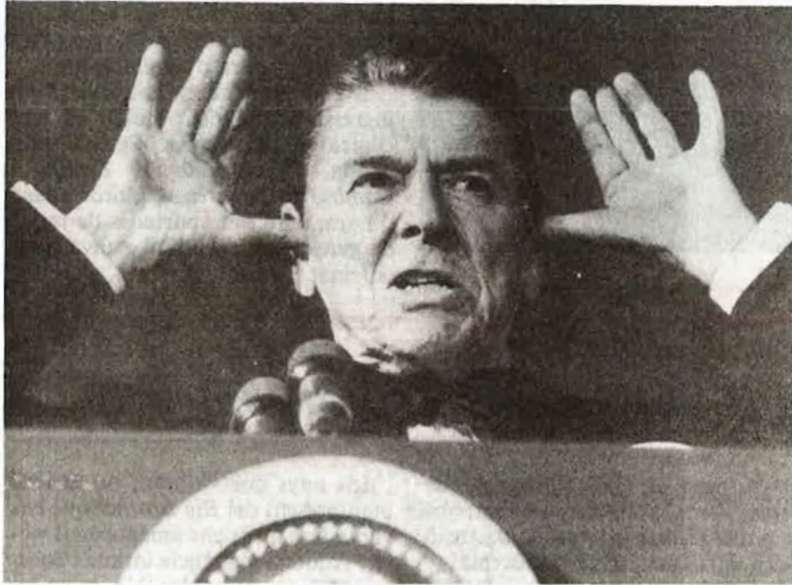
Reagan guanyà les eleccions a Mondale