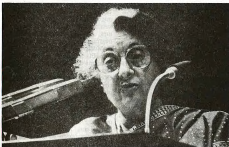
Indira Ghandi queia assassinada sota el pes de les bales dels sikhs

d'accedir a les extradicions d'etarrés. Dues morts de persones de la mateixa professió, però distants en l'espai i l'estil, es produïren en aquest mes: Martí Domínguez moria el dia 10, mentre que Truman Capote moria a causa dels excessos d'alcohol, als quals es veuen sovint abocats els novel·listes.