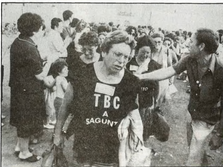
1984 fou l'any de la rendició de Sagunt

Andròpov, el 10 de febrer, se n'anà un cap de setmana a la Dacha i, d'allí, tot seguit al barri dels ovis . La vacant, l'ocupà Txernenko, de salut precària i de l'ala dura. Pel camí, Andròpov i Julio Cortázar es degueren saludar, ja que el gran escriptor moria el dia 12. Andròpov ens deixà la tensió entre els dos blocs militars, Cortázar, la novel·la Ra-