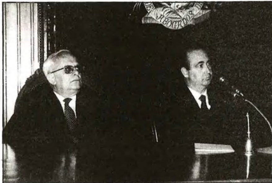
En un acte del Col·legi d'Advocats de València

R.- Precisament, sobre aquesta qüestió he realitzat un estudi sobre la Llei de l'Ús del Valencià davant dels Tribunals de Justícia, que es publicarà com un article en una revista espe-