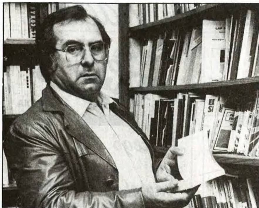
«Les vides dels marginats són reals i no són versemblants»