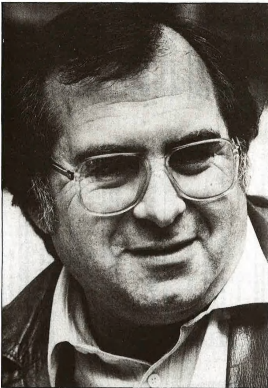
«A allò que ara sóc, hi he arribat per un procés, no per una determinació»

«Hi ha una cosa que m'obsessionava: què hi ha darrere d'aquesta vida, d'aquest home —ens diu l'escriptor—. Potser Mamil·la, encara , és una aparició del subconscient, però és més una novel·la d'investigació psicològica dels primers mesos d'un infant. D'altra banda, crec que tot el