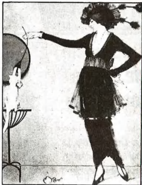
Dues obres de Gosé, «Figueres» (1911) i «Jugant amb el gat» (1914)