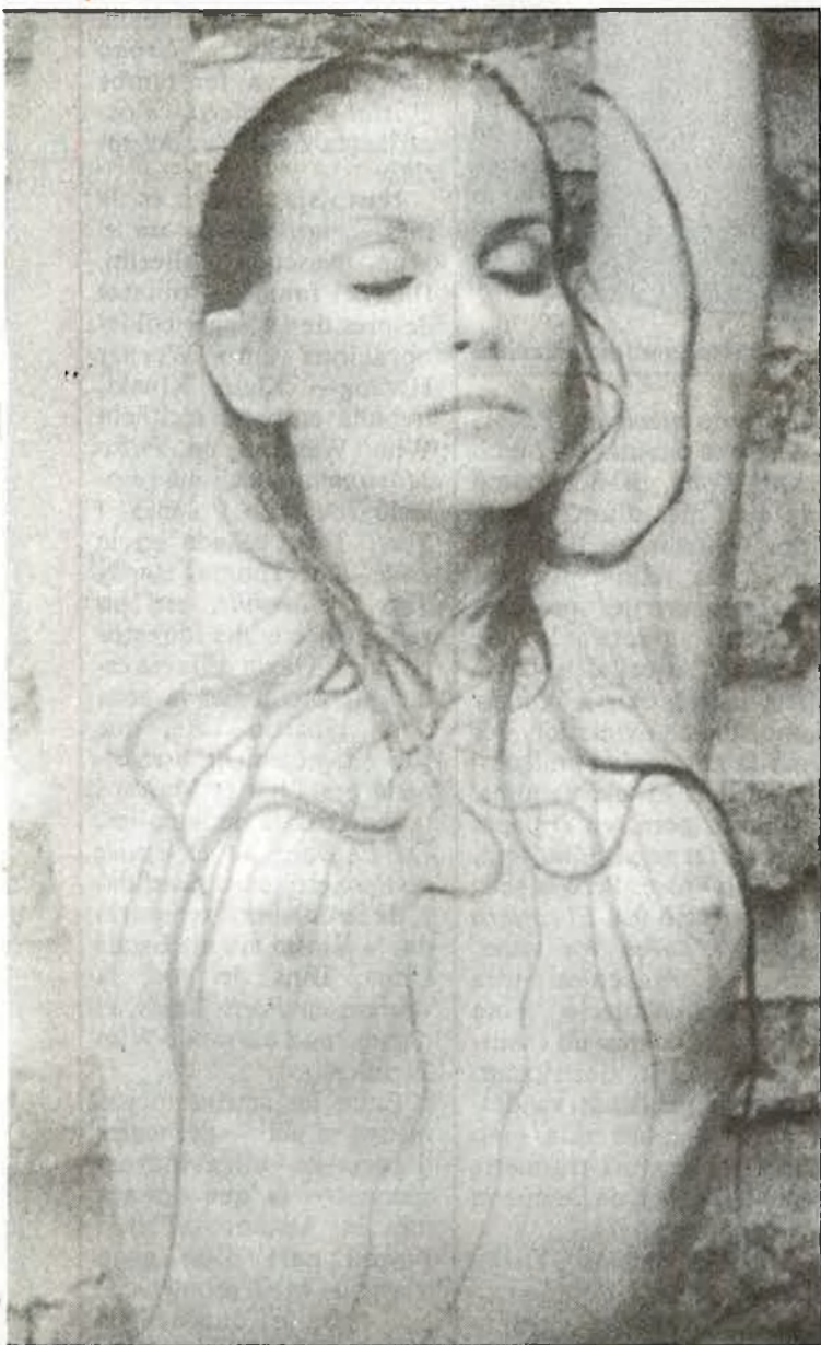
Bo Derek ¿un nou «sex-symbol»?

La unanimitat aquella del reialme de Marilyn y Brigitte ha quedat trossejada per la profusió i la confusió d'aspectes i de caràcters. Americanes i europees, rosses i morenes. Poca