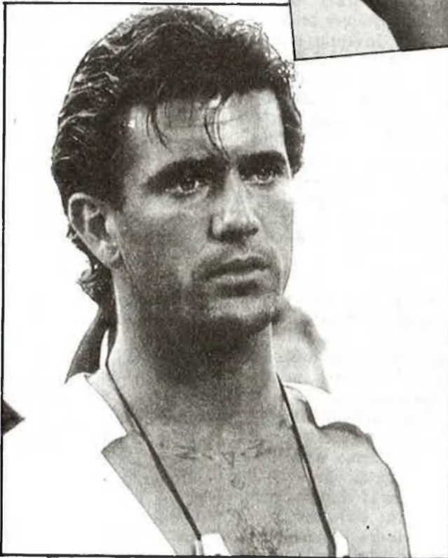
Mel Gibson, el capità Fletcher Christian de «Motín a bordo»

aliento. I d'altra banda, la Detmers encarnà la Carmen de Godard, que, com a inici, no està gens malament.