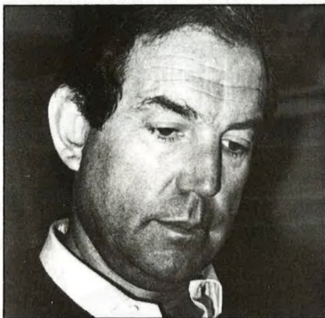
Per a Garaikoetxea, era un problema de resistència

Dos criteris, el del reforçament modern de les institucions d'autogovern davant les diputacions forals i el «foralista», reivindicador d'uns «drets històrics» tradicionals d'aquests organismes, topaven i polaritzaven darre-re seu les dues tendències del partit. Gràcies a un sistema de representació territorial no proporcional, l'aparell de l'organització, amb l'ombra influent de Xabier Arzallus en la reraguarda i un