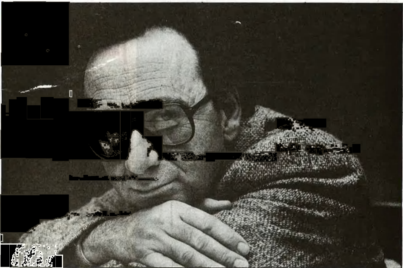
Per a Mira, el problema nacional és un dels més actuals i complexos