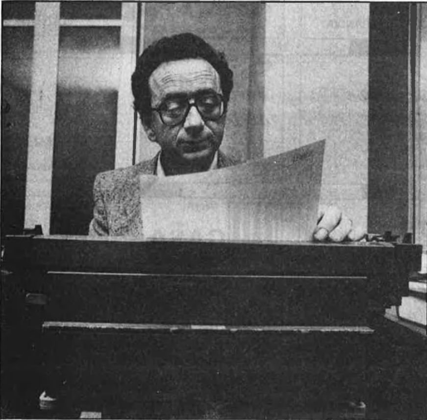
«Els valencians tenim un problema nacional»

Hi ha, finalment, pel que fa a aquest aspecte, el gran problema de com definir Espanya si no és en conjunt. Si en llevàvem Euskadi, els Països Catalans, Galícia... allò que en quedaria no té un nom autoidentificador. La nació més important de la península és incapaç de definir-se en termes propis. Ho ha de fer absorbint, incorporant i ocupant.