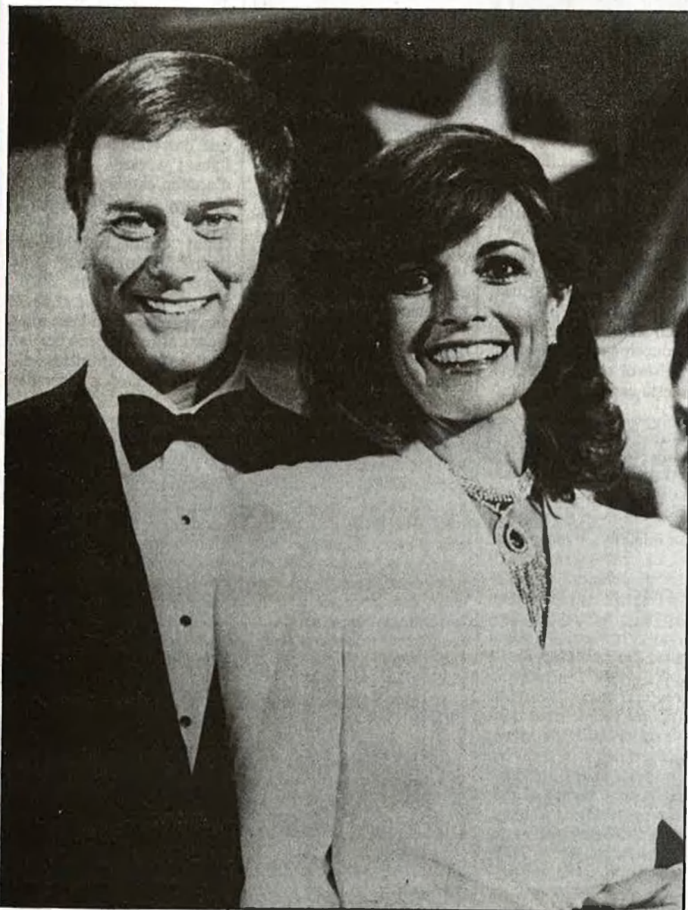
La sèrie «Dallas» continua entusiasmant

La TV-3 s'estén pel País Valencià, cada vegada més. Però no amb la normalitat que fóra desitjable. Manca un repetidor que, situat en algun punt de les comarques centrals, possibilita una bona imatge. Per uns motius o per uns altres, el veïnat la demana.