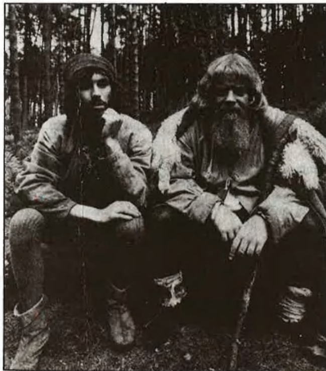
«És curiós oír parlar el nostre idioma als actors americans»