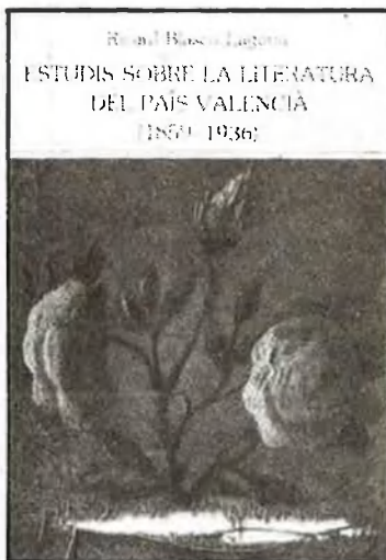
Portada d'uns dels llibres que es presenten

de 1.000 pàgines i col·laboracions de més de cent filòlegs d'arreu del món.