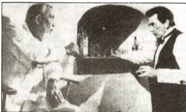
Huston i Finney en un moment del rodatge de la pel·lícula

La immediata incorporació a la llista d'obres mestres de la literatura contemporània assegurarà a la novel·la de Lowry —que morí al seu país natal, Anglaterra, l'any 1957, en condicions no ja similars sinó idèntiques al cònsol Firmin— les també immediates traduccions a les principals llengües. L'any 1973, mesos abans de l'onze de setembre xilè, Edicions 62, recentment guardonada amb la Creu de Sant Jordi, en publicava la versió catalana.