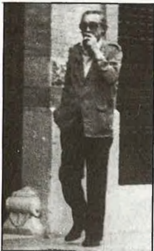
L'escriptor, passejant per Sueca