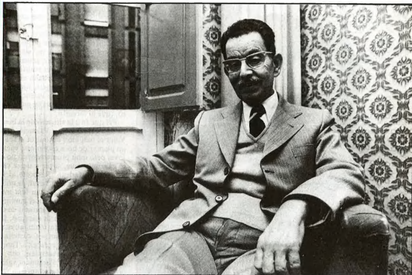
«Parle de la terra com la coneix»