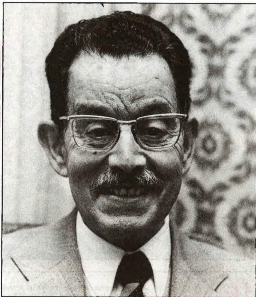
«Tinc el cor jove»