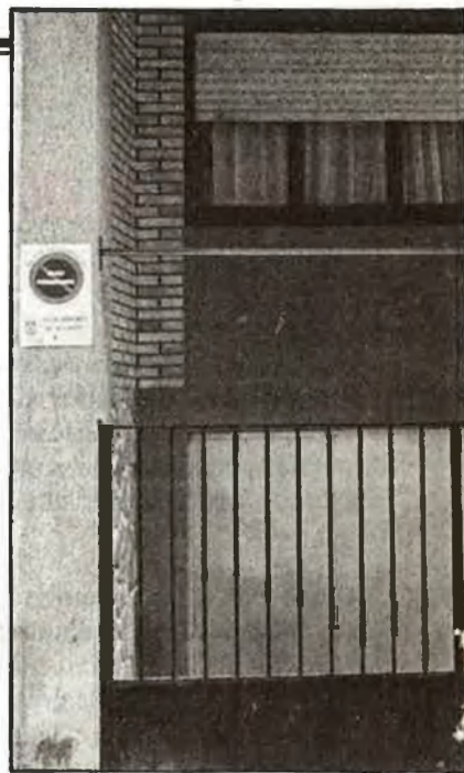
Planta baixa del carrer Espronceda, on s'instal·la la L

ha decidit rememorar davant d'un desconegut periodista l'etapa més decisiva i conflictiva de la seua breu biografia. La d'ell, i