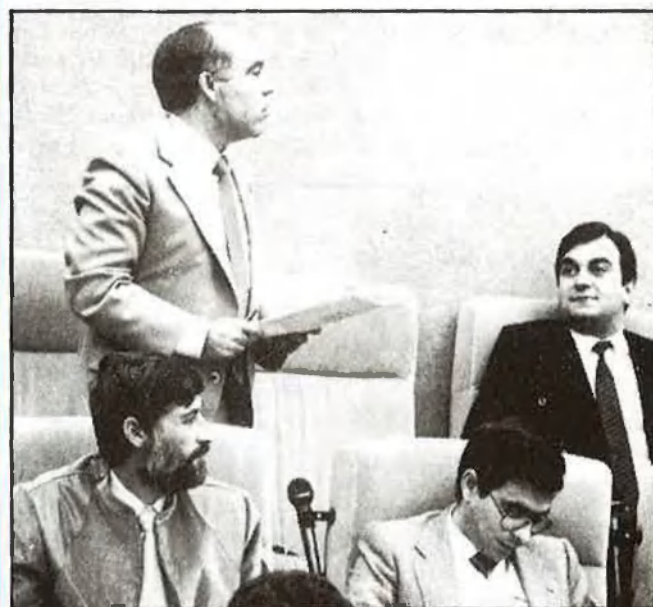
Els comunistes no legitimaren amb el seu vot l'agressió