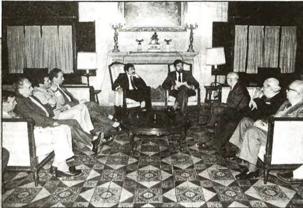
«Seria ignominiós que no es recollís el símbol més antic dels valencians...»