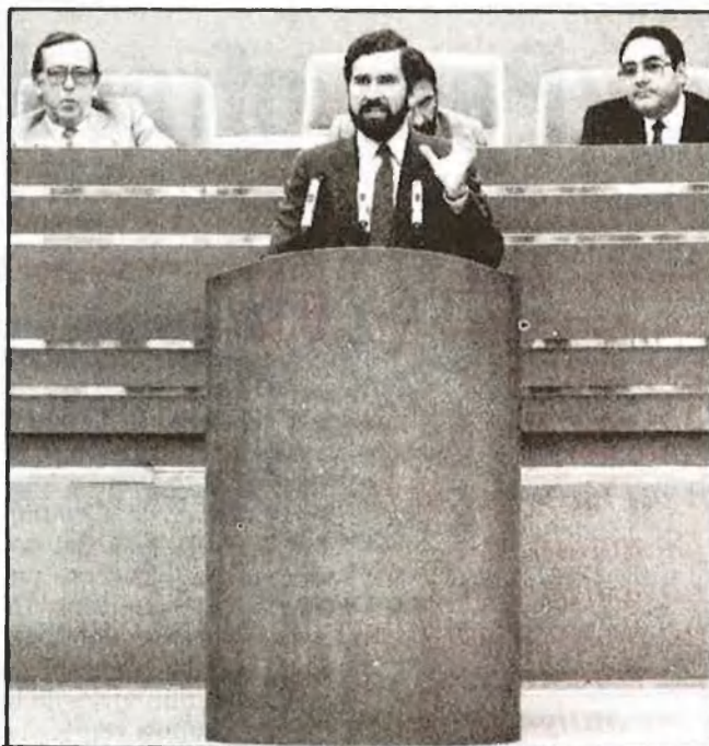
El president: «Hui no avancem en marxa triumfal»

Amb una expectació inusitada, i en un ambient de desbordada eufòria entre les senyories populars (guanyadors fora de casa i per golejada, gràcies