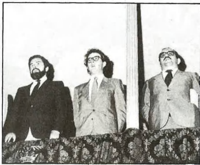
«Unidad de ideas, concordia de voluntades»