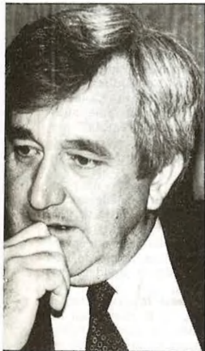
/ Joan Miquel Ferrà

Cañellas sembla trobar-se molt segur en el càrrec