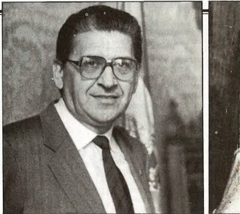
Albertí condiciona el seu suport a les investigacions sobre la conducta de Canellas. Gabriel Cañellas

Aquesta és la solució que s'ha donat a la que ha estat la crisi més seriosa soferta pel govern Cañellas des de la constitució, ara fa poc més d'un any i mig. I s'hi ha arribat després de tres dies de tensió, de viatges a Madrid i de fortes