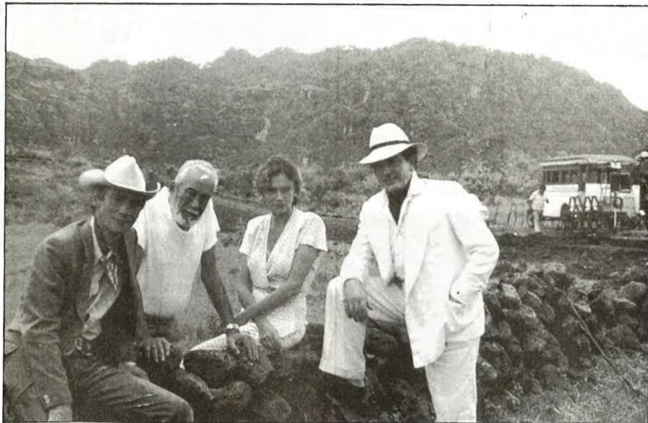
John Huston i el grup d'actors de «Bajo el volcán»