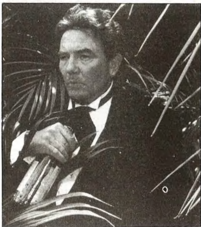
Albert Finney és el cònsol a «Bajo el volcán»

cinquanta a les pàgines de la revista Life , mentre el no menys sagaç Andrew Sarris, una dècada després, el classificava en el seu llibre The american cinema en el capítol dels «Less than meets the eye», «Menys del que semblen en una primera ullada» . A París, Eric Rohmer, en la seua època de crític de Cahiers du Cinema , arribà a afirmar: «només amb