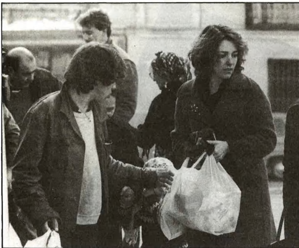
Carmen Maura en una escena de «¿Qué he hecho yo para merecer esto?»

Enmig de la resistència de molts, Almodóvar seguirà fent de les seues, entre l'art, la música i el cinema, dins de la promiscuïtat del mogollón de Madrid, deseixint-se'n, com un tigre més, que guaita desde qualsevol cantonada, al teu costat.