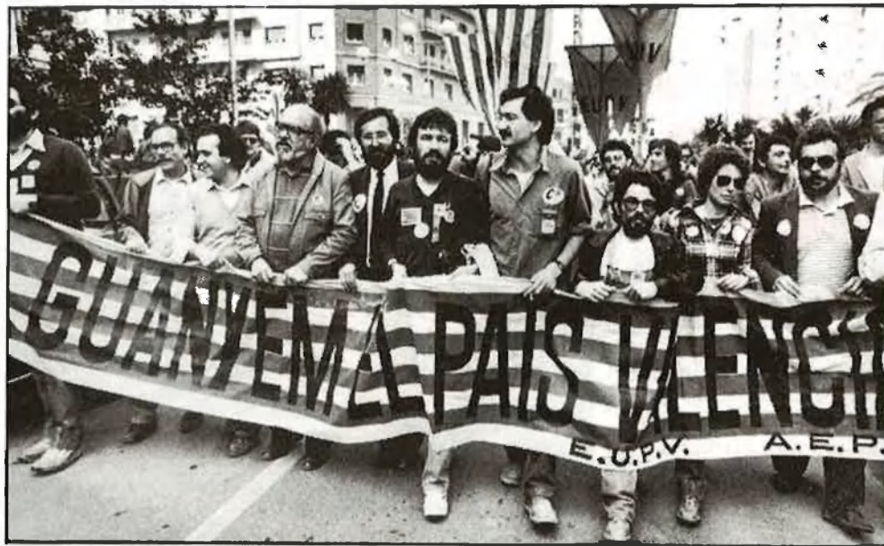
El nacionalisme ha demostrat una forta capacitat de mobilització. 25 d'Abril 1982 a Castelló

Dels anys seixanta a l'actualitat hi ha un llarg camí que el nacionalisme polític ha recorregut amb entusiasme i dificultats. A UPV hi ha molta gent nova, i hi ha també gent que ha passat per molts dels múltiples intents en què s'ha plasmat la història recent del moviment. Heus ací una aproximació sintètica a la cronologia d'aquest procés.