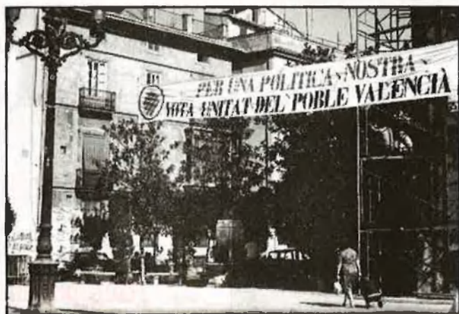
La primera aparició pública d'Unitat fou en les eleccions generals de 1982

d'Esquerra del País Valencià (AEPV), el qual inclou el sector despenjat del PSAN, sectors renovadors i nacionalistes procedents del PCPV i del PSOE, i grups d'independents. Un acte defineix i simbolitza l'esperit unitari que comença a generar-se en un moviment nacionalista fragmentat. Es tracta del míting que contra el projecte d'Estatut de Benicàssim se celebra a la Sala Escalante de València, amb gran assistència de públic i