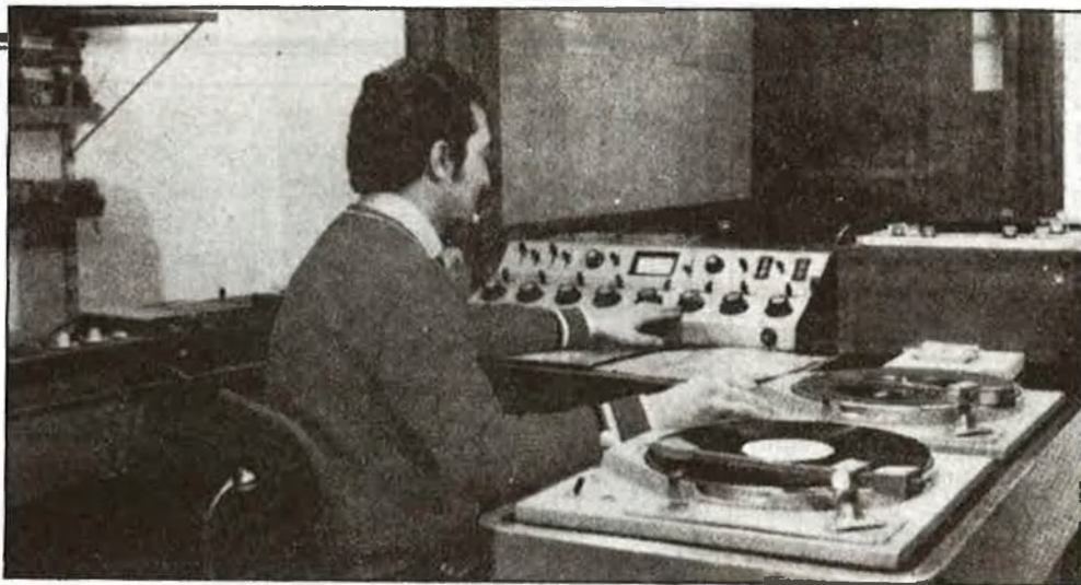
Hi ha temes, persones i institucions que poden provocar disgustos

Fa unes setmanes, el guió «Romances de Sacristía», emès per Ràdio 3, suscitava un nou episodi en què la llibertat d'expressió quedava en situació difícil. EL TEMPS n'ha aconseguit el text, ple de referències que han despertat les ives de sectors catòlics poderosos.