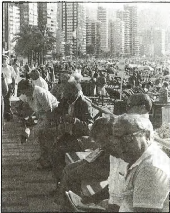
La majoria del turisme en temporada baixa és de la «tercera edat»

Un cas significatiu en tot aquest món, el constitueix «Ciudad Patricia», una singular urbanització que es presenta en la seua promoció com «la ciutat de la tercera edat». Només admet entre els residents persones més grans de seixanta anys, que adquireixen l'usufructe vitalici d'un apartament, i no la seua propietat, mitjançant un dipòsit de cinc milions de pessetes, que es tornen als hereus quan mor l'interessat, o a ell mateix, si se'n cansa. Una iniciativa absolutament privada n'amortitzà la inversió, d'uns dos mil milions de pessetes, fa