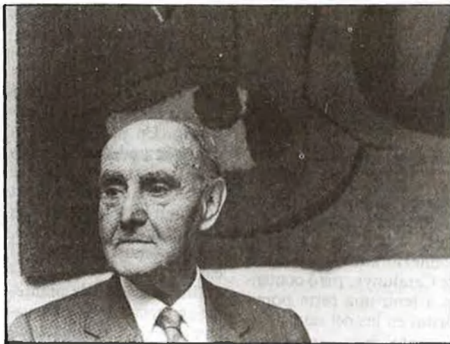
El poeta català Josep Vicenç Foix

Ara convindria distingir bé aquest Premio Nacional de las Letras Españolas del Premio Nacional de Literatura, que també és nacional i és espanyol, però