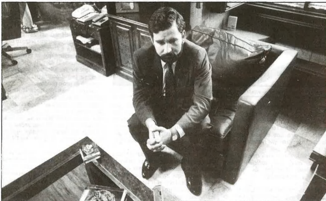
Aconseguirem recuperar el valencià, malgrat les dificultats

R.-Des del moment que vam entrar en la Generalitat valenciana, i ja abans de les eleccions autonòmiques, ens vam plantejar que l'Autonomia no era un procés de gestió de