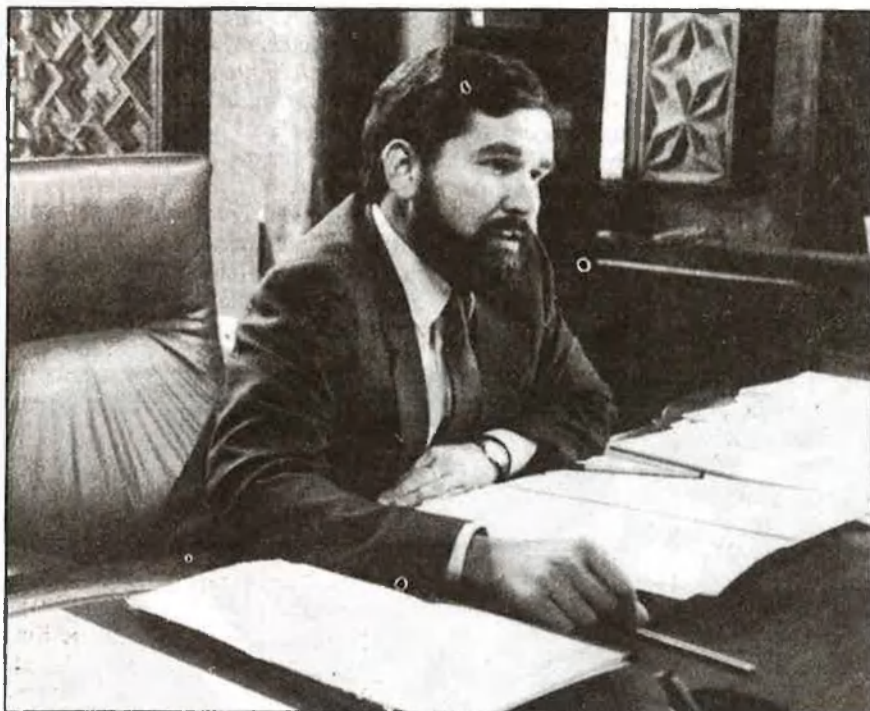
Els símbols no són res, si no els accepta una àmplia majoria