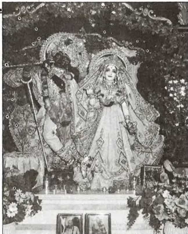
Krsna i la seua amant eterna Radavari

La frescor d'octubre no aconsella la collita d'hortalisses. Els camps de la finca, la majoria, estan per sembrar, i les flors, producte que s'ofereix a les deïtats (déus) diàriament, han de créixer en un petit hivernacle situat a escassa distància de la gran casa que acull els seguidors de Krsna. Pels voltants regna un silenci absolut trencat, de tant en tant, per l'esgarrada veu d'un paleta que, indiferent però laboriós, intenta dur endavant les notes musicals d'una cançó de Valderrama. El treball de construcció i les faenes del camp, les fan conjuntament personal de fora i fidels de la granja.