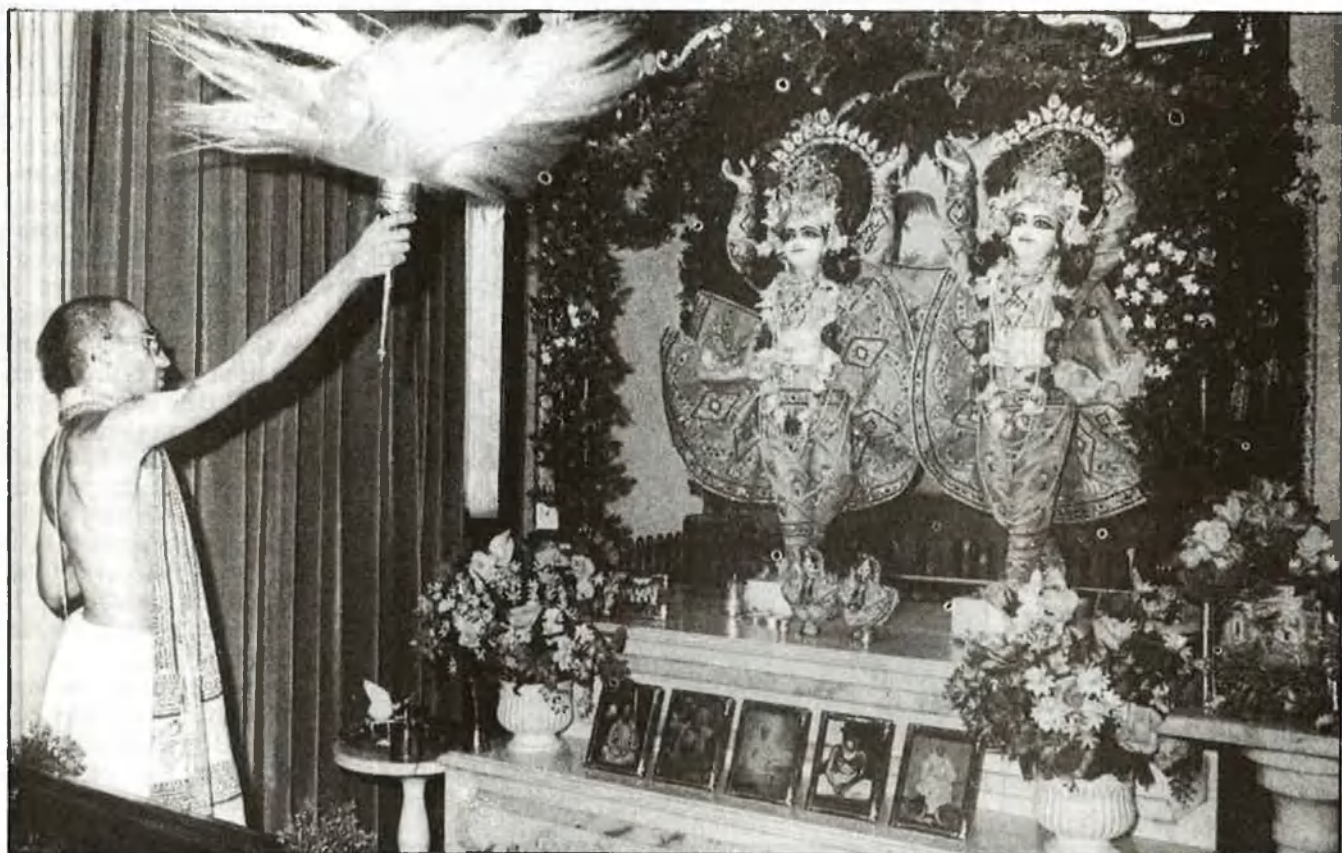
El treball espiritual és aclaparador