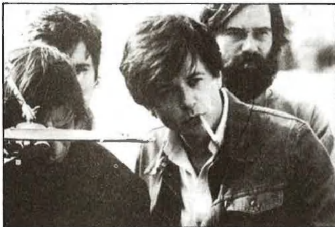
Patrice Chereau, director de «El hombre herido»

L' homosexualitat en el cinema ha tingut un tractament diferent al llarg de la seua història. Pel·lícules com ara ¿Victor o Victoria? , de Blake Edwards, enfocaven la qüestió —el tema, que diria un polític— d'una forma simpàtica i desimbolta. Autors com Fassbinder, el qual la matèria afectava de prop, la tractaven des d'un angle més dramàtic i conflictiu. La francesa El hombre herido , de Patrice Chéreau, ho fa amb una intenció matisadament tràgica.