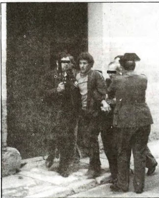
La guàrdia civil i els GEOS detenen els delinqüents

Poble de tres mil vuit-cents habitants de la Ribera Alta, el veïnat de Torís és dedica quasi exclusivament a les faenes del camp, llevat d'un percentatge molt petit de la població laboral, ocupats en les tres fàbriques que hi ha als afores del poble. Dues mil dues-cents hectàrees, d'un total de vuit mil, són dedicades al conreu del raïm, del qual s'extrau un orgullós vi de taula, famós en la comarca. La resta de terrenys apareix plantada de tarongers, garrofers, oliveres i distintes classes de fruita en menor proporció.