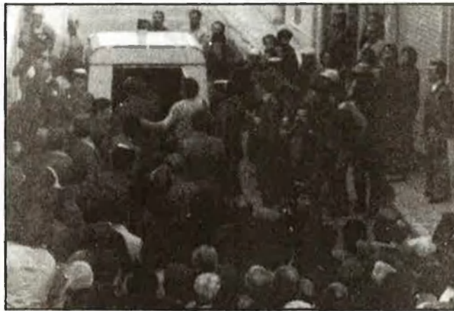
La població, furiosa, pretenia linxar-los

A les primeries d'octubre d'enguany aparegué socarrat un 850 de color blanc, aparcad a la vora d'un camí de la partida d'Albaina. Tres o quatre persones, situades a un centenar de metres del vehicle, recollien garrofes a corre-cuita. El furt era observat per un grup de llauradors que, sense cap avis més, calà foc al cotxe dels eventuals recollidors. Aquests intentaren desesperadament salvar el 850,