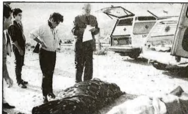
Set de les morts foren instantànies