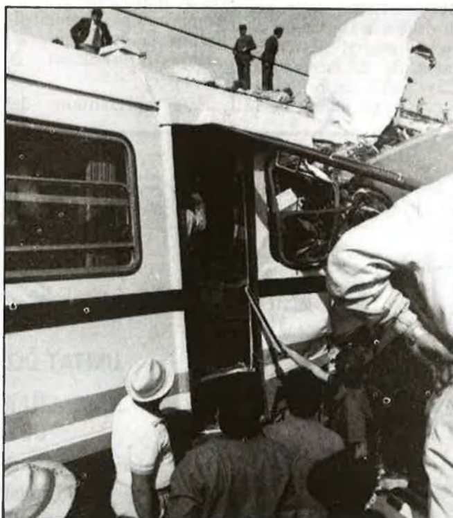
Els combois s'incrustaren l'un en l'altre

Una reforma eficient del trenet ha d'evitar d'altres accidents, de menys envergadura, però més fre-