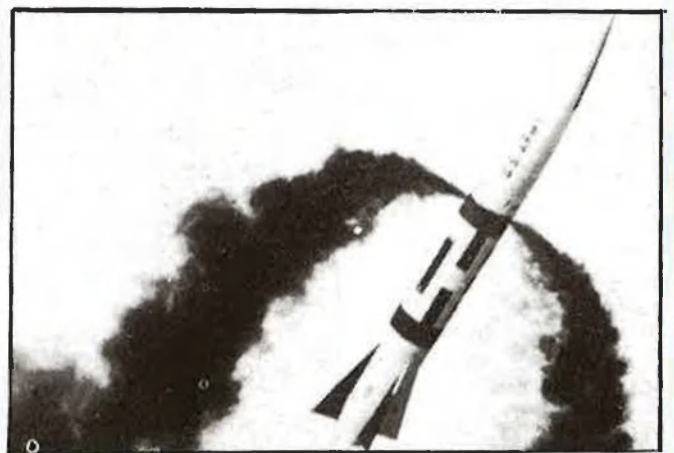
Míssil portador d'una bomba de neutrons