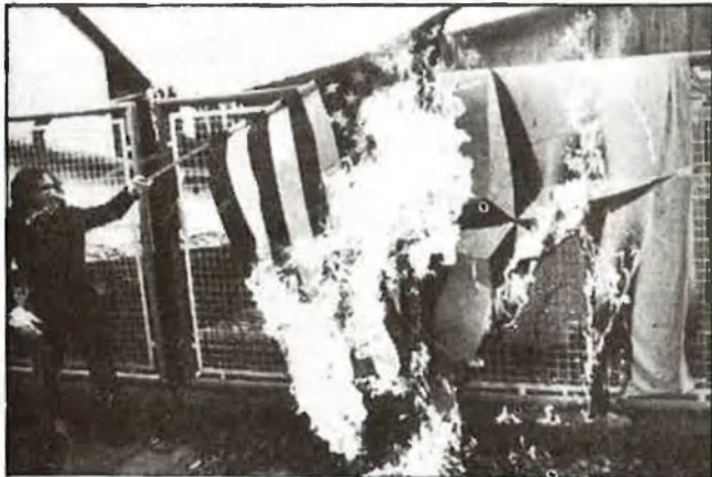
El desplegament dels Pershing II a l'Alemanya Federal originà tot de protestes

Occidental—. També apunten a uns altres indrets, naturalment: l'Alemanya Occidental, França, la Gran Bretanya, i els Estats Units. Però el que ens hauria de neguitejar, a nosaltres, és que, de fa uns anys, ja n'hi ha una pila de noves que apunten cap a la Mediterrània Occidental. Se sap que s'alcen en tres zones geogràfiques principals: la Península de Kola, al nord; la Mar Negra, al sud; i la Bielorússia, que acabem de sobrevolar (això sense comptar les noves instal·lacions que enguany mateix han començat a enllestir a Txecoslovàquia i a l'Alemanya de l'Est, per obra i gràcia dels míssils «de Creuer» i «Pershing»).