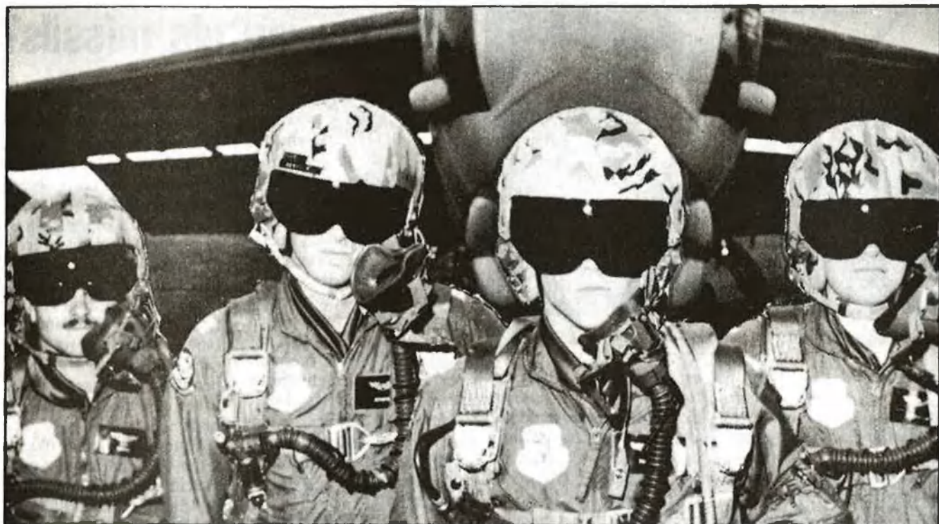
La tripulació d'un bombarder B 52 nord-americà, preparada