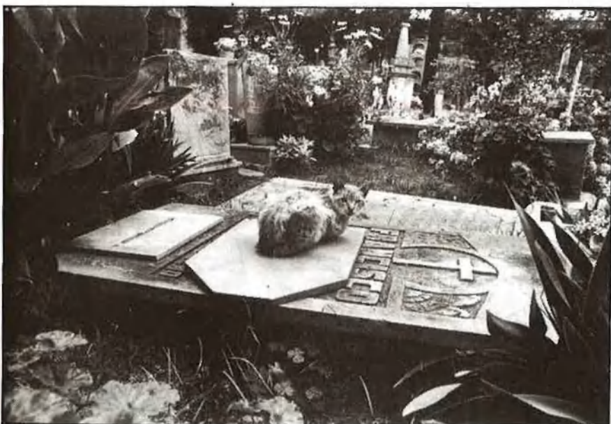
Una pesada llosa de marbre, entre gats, plantes i flors...

De tota manera, l'arrelament esdevé indiscutible, i la burgesia valenciana es llança amb entusiasme a emprar-ne els elements més característics, tant en l'ornament de les llars com en l'edificació de túmuls i panteons, que són, ja en les darries del segle passat, una incontestable necessitat social com a mostra de prestigi i de benestar econòmic. La competència interfamiliar comp-