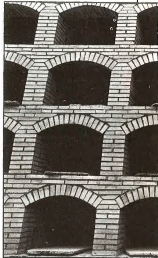
«Dormitoris» bigarrats i quasi industrials per al somni etern

Les referències arquitectòniques i simbòliques, el color, els materials de construcció i els ornaments de nínxols i panteons tenen relació directa, segons explica Vicent Garcia, amb l'estil de la burgesia semirural valenciana, que decideix, entre la se-