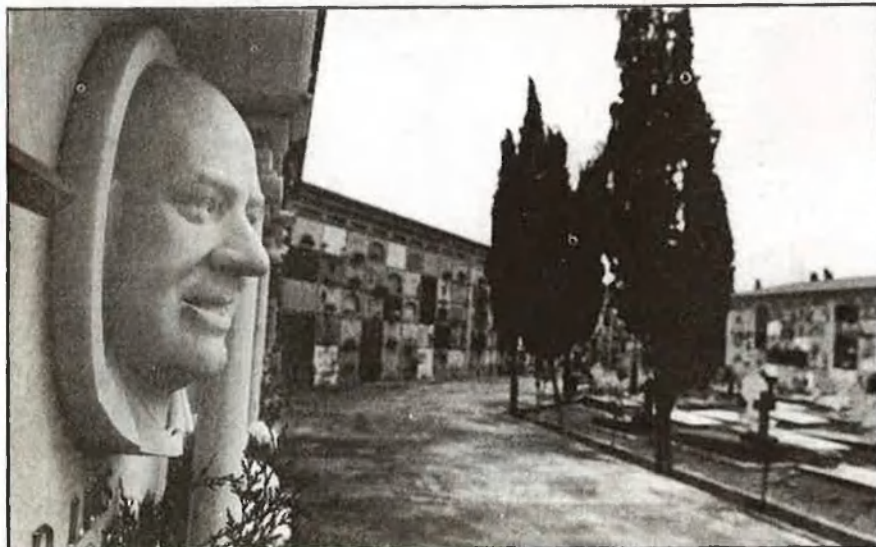
Xiprers i nínxols als tranquils carrers del cementeri

Els valencians, potser un gra massa aficionats al barroquisme decoratiu i a l'estètica «fallera», no som, però, excessivament retorçats. El nostre repertori fúnebre s'escota en manifestacions de sentimentalisme, de prepotència econòmica (vegeu alguns panteons) i de retòrica tristesa, però mai no traspasa els límits d'allò humanament suportable. La sensació predominant, en passejar pels nostres cementeris, és de tranquil·litat. Els nombrosos gats que s'hi han instal·lat, sense respectar ni tan sols els sepulcres més il·lustres, ho demostren. Al cementeri del Cabanyal, sense anar més lluny, ventrades senceres habiten al fons dels fossars més antics.