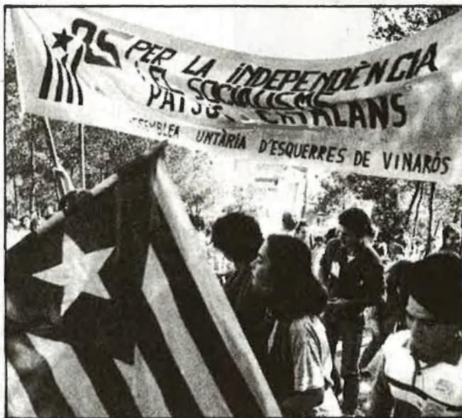
XXV Aplec del País Valencià