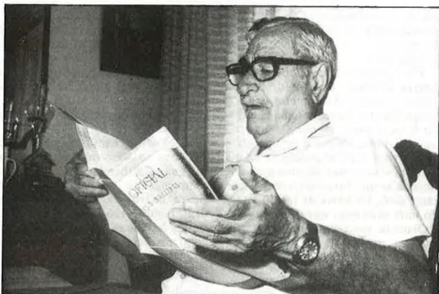
Masip fou ajudant da camp del general