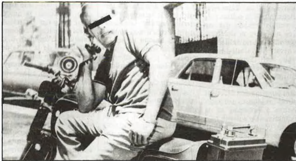
Detectiu motoritzat per tal de salvar els obstacles de la circulació urbana

Els investigadors privats consideren que no és perillós saber tant com ells saben: «perillós no, incòmode. Jo abans feia una vida social intensa, perquè coneixia infinitat de persones. Però vaig haver de deixar d'eixir perquè la gent que hi havia al meu voltant se sentia malament. Ells sabien que jo sabia». És l'estigma de la professió: la solitud de l'home discret.