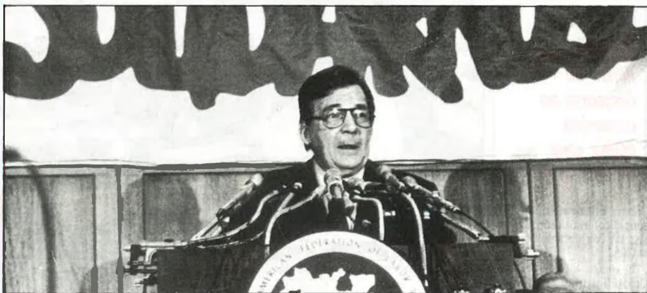
El president de l'AFL-CIO, Lane Kirkland, en un acte a favor del sindicat polonès Solidarnosc